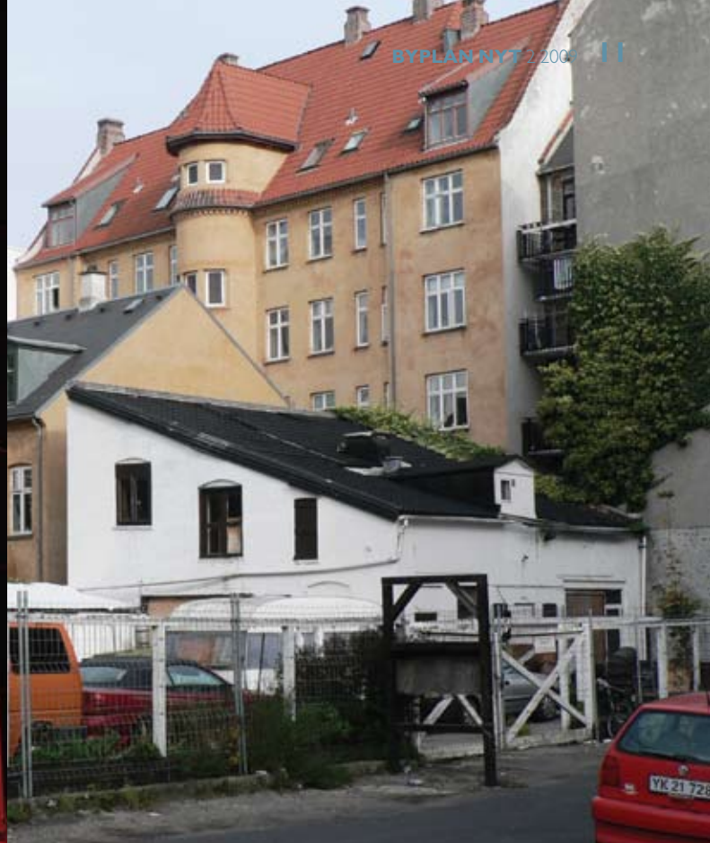
Sundholmsvej kvarteret har en meget blandet karakter.

øge livskvaliteten. ”Vi arbejder med at give beboerne et kompetenceløft. F.eks. ved at uddanne lokale ambassadører, der rådgiver beboerne om, hvordan de kan spare på energien. Det har vist sig at være en god måde at hæve bevidstheden og selvfølelsen, så beboerne oplever, at de er en del af et kvarter, der gør noget”, siger Øystein Leonardsen. En anden udfordring i arbejdet med bæredygtighed er tidsperspektivet. Det kan være vanskeligt at fastholde energien og interessen hos beboerne, når det varer år, før indsatsen viser resultater.