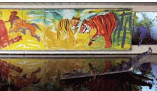
Albertslund Kommune. Vinder af Byplanprisen 2008

2008 Albertslund kommune 2007 Silkeborg Kommune 2006 Aalborg Kommune 2005 Horsens Kommune 2004 Trekantområdet Danmark 2003 Københavns Kommune 2002 Herning Kommune 2001 Vejle Kommune 2000 Odense Kommune 1999 Esbjerg Kommune 1998 Grenå Kommune 1997 Køge Kommune 1996 Århus Kommune