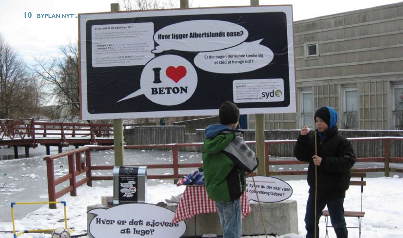
I februar var "høresneglen" på gaden for at høre, hvilke ønsker beboerne i Albertslund Syd har til boligområdets byrum. Her er det to drenge, der får sig en stegt marshmallow, mens de øser om sig med ideer.