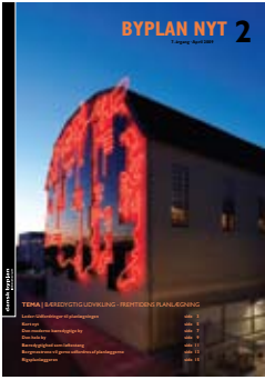
BYPLAN NYT nr. 2 / 2009 (7. årgang)

Redaktion Ellen Højgaard Jensen (ansv.) Marie Horskær Partoft