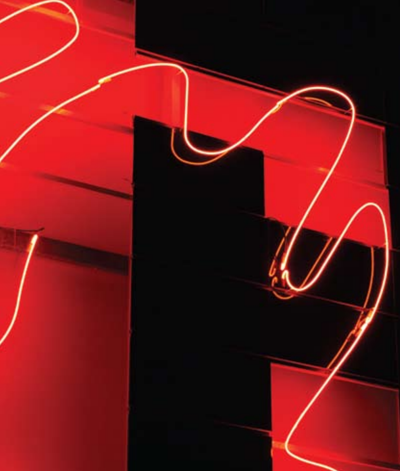
Detalje fra Anita Jørgensens solcelle kunstværk i Valby.